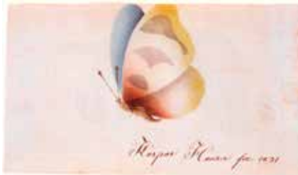
Kaspar Hauser, Schmetterling, 1831, Aquarell auf Papier, 19x11,8 cm. Stadtarchiv Ansbach

JB Was sind deine aktuellen Forschungsprojekte zu Kaspar Hauser?