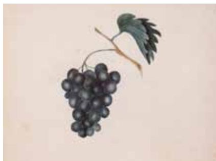
Kaspar Hauser, Weintraube mit Blatt, 1833, Aquarell auf Papier, 22x19,5 cm. Stadtarchiv Ansbach

wissen Stand der Bewusstseinsseelenentwicklung hätte verbleiben müssen. Dieser Riss aber wurde durch Kaspar Hauser unterbunden. Dadurch hält er aufrecht den künftigen Menschen. Der Mensch kann weiterhin zu jenem König werden, der er durch die Gnade des Christus ist. Er muss es jedoch aus seiner Freiheit heraus wollen, nur so kann er sein Erbe annehmen. Kaspar Hauser hat gewissermaßen unser aller Erbprinzentum aufrecht erhalten.