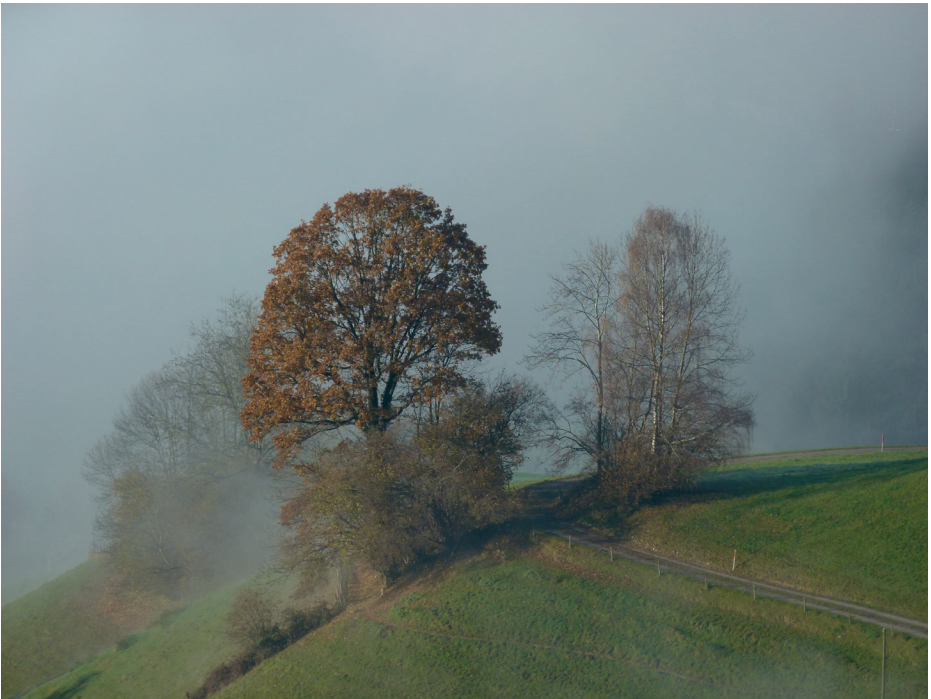
Mystisches Emmental.

Wir freuen uns, Sie an diesem besonderen Kraftort begrüßen zu dürfen.